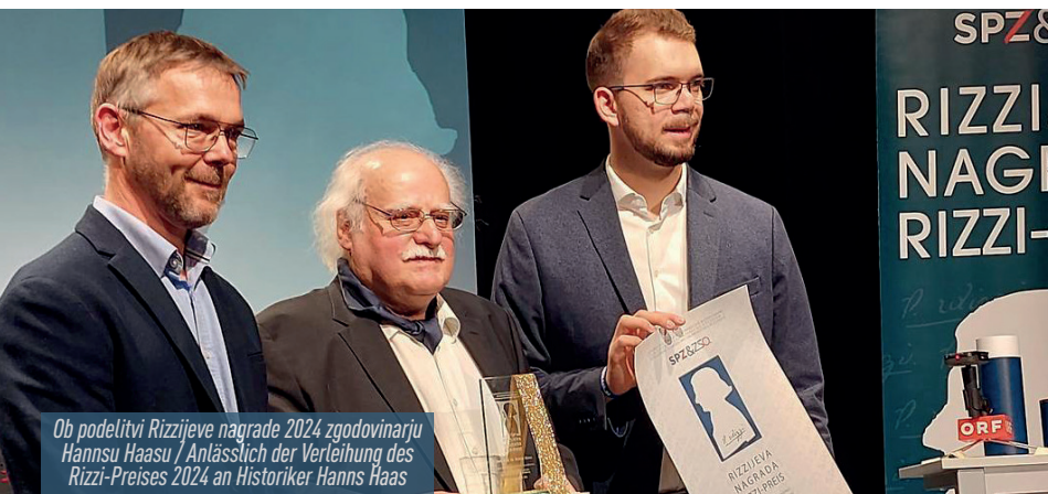
Ob podelitvi Rizzijeve nagrade 2024 zgodovinarju Hannsu Haasu / Anlässlich der Verleihung des Rizzi-Preises 2024 an Historiker Hanns Haas