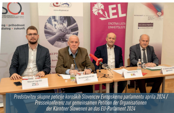
Predstavitve skupne peticije koroških Slovencev Evropskemu parlamentu aprila 2024 / Pressekonferenz zur gemeinsamen Petition der Organisationen der Kärntner Slowenen an das EU-Parlament 2024