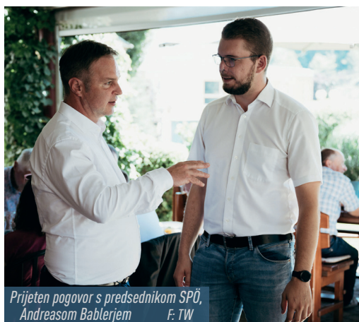
Prijeten pogovor s predsednikom SPÖ, Andreasom Bablerjem