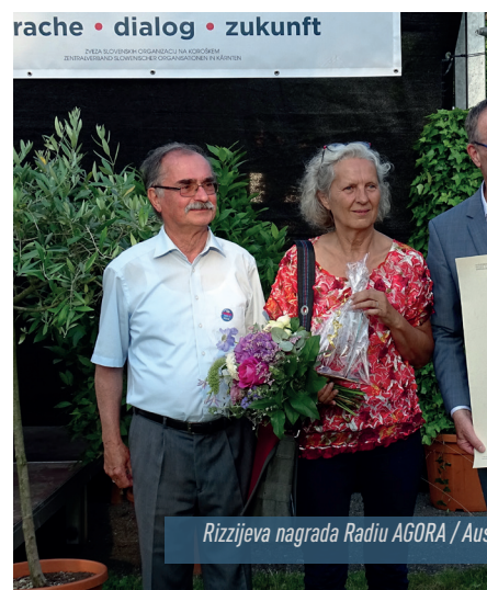
Rizzijeva nagrada Radiu AGORA / Aus