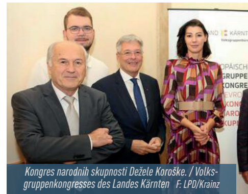
Kongres narodnih skupnosti Dežele Koroške. / Volksgruppenkongresses des Landes Kärnten