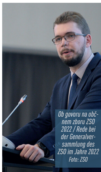
Ob govoru na obnem zboru ZSO 2022 / Rede bei der Generalversammlung des ZSO im Jahre 2022