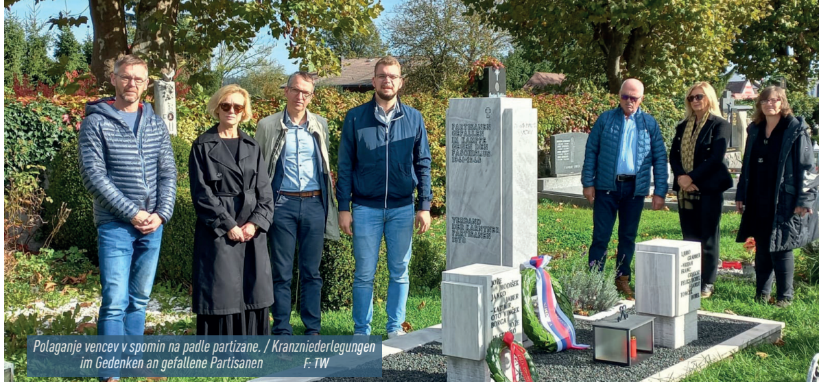
Polaganje vencov v spomin na padle partizane. / Kranzniederlegungen im Gedenken an gefallene Partisanen