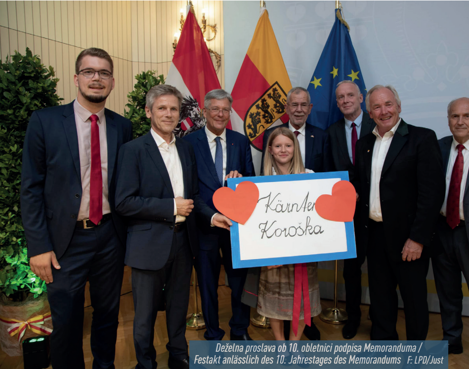
Deželna proslava ob 10. obletnici podpisa Memoranduma / Festakt anlässlich des 10. Jahrestages des Memorandums