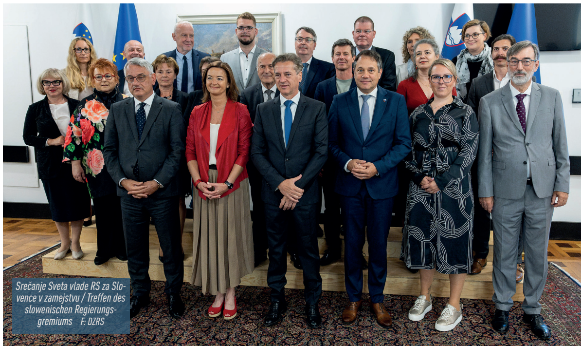
Srečanje Sveta vlade RS za Slovence v zamejstvu / Treffen des slowenischen Regierungsgremiums