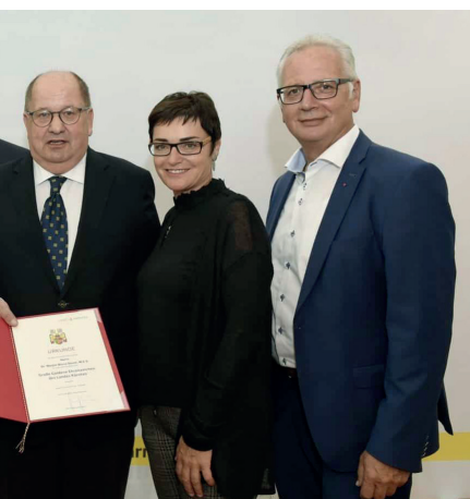
A / Auszeichnung des ZSO für Radio AGORA