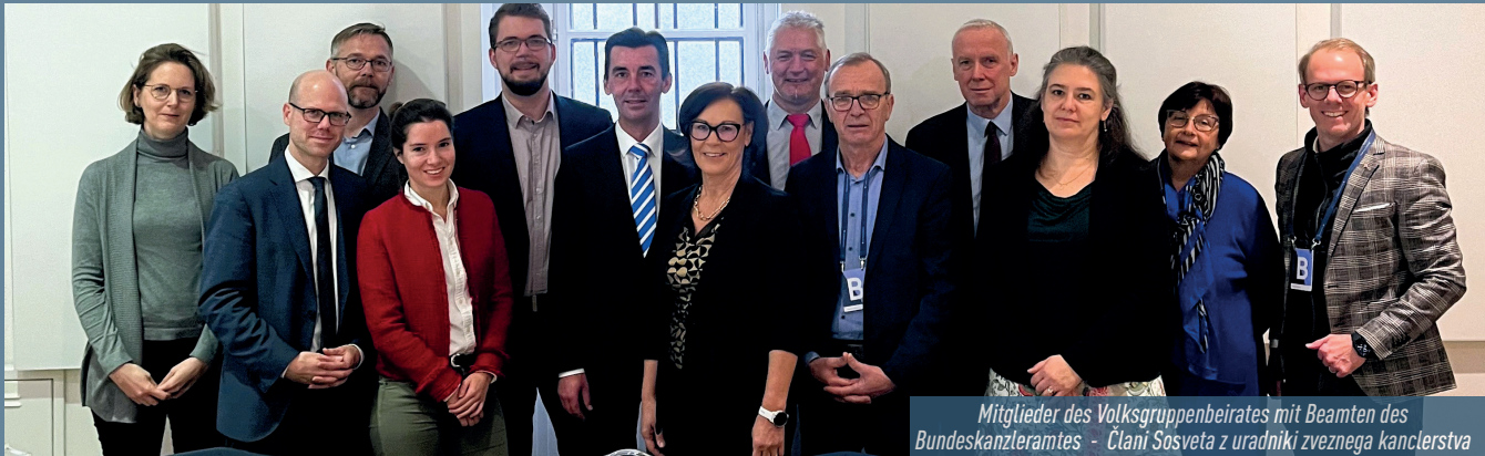
Mitglieder des Volksgruppenbeirates mit Beamten des Bundeskanzleramtes - Člani Sosveta z uradniki zveznega kanclerstva

Politik muss auf gesellschaftlichen Wandel und demografische Veränderungen mit einer Anpassung in der Minderheitenschulgesetzgebung reagieren.